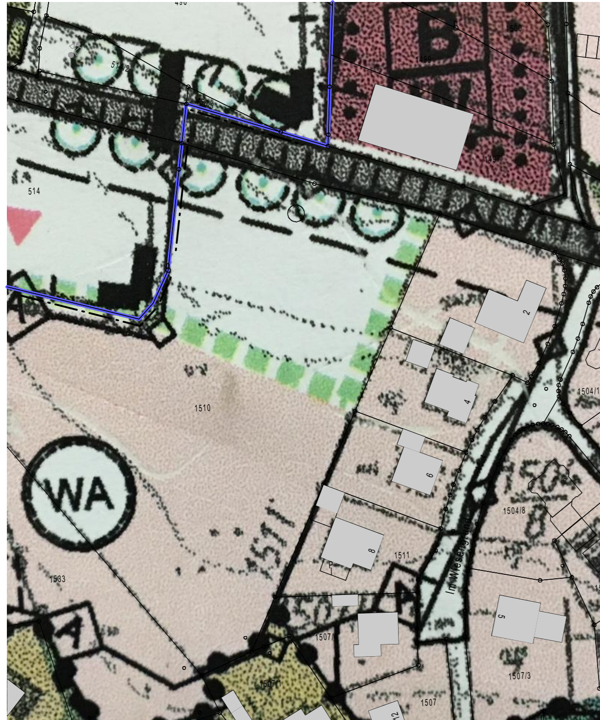
Auszug aus dem Flächennutzungsplan 1:1000 Bestand